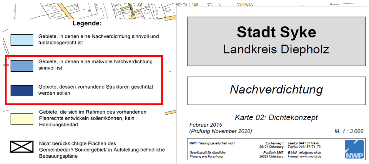
Karte 02: Dichtekonzept – korrigierte Legende