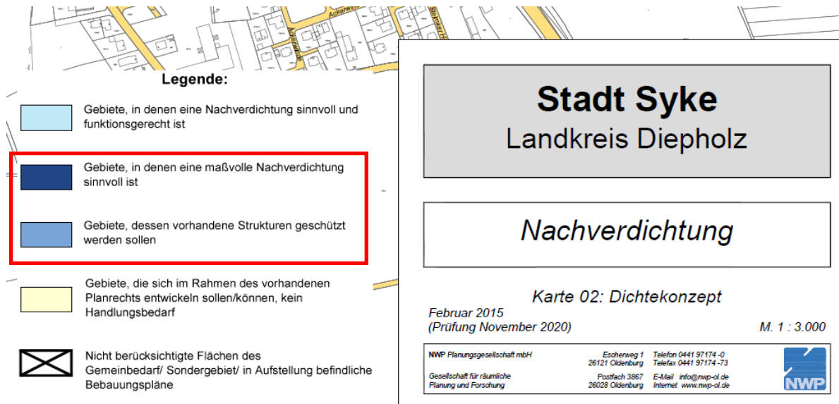
Karte 02: Dichtekonzept – fehlerhafte Legende