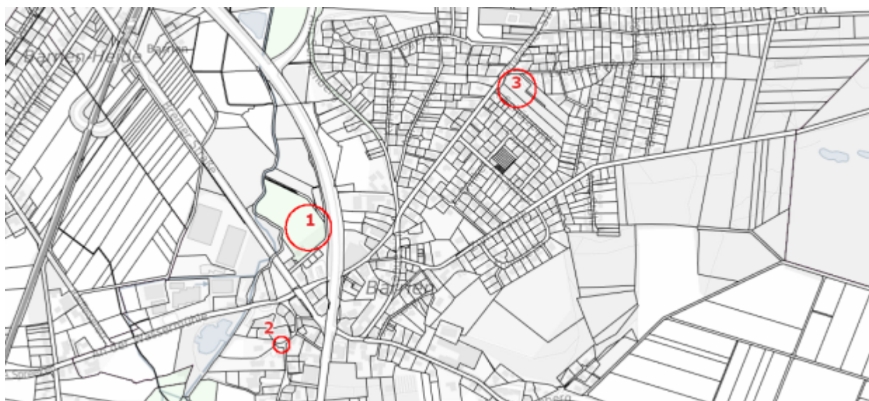
Abbildung 1: Räumlicher Zusammenhang der für Veranstaltungen zur Verfügung stehenden Flächen

In Barrien stehen zwei planungsrechtlich gesicherte Flächen für Veranstaltungen zur Verfügung, sowie eine weitere derzeit bereits genutzte Fläche.